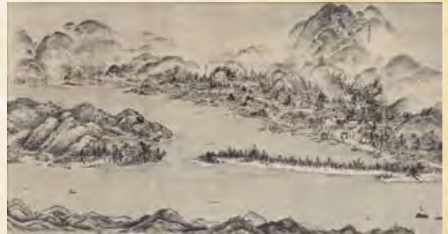
▲雪舟(複製)《天橋立図》、(公財)総社市文化振興財団蔵、前篇で展示

※カーナビをご利用の場合は、岡山県総社市上林 1112 付近の「吉備路風土記の丘県営北駐車場」を目的地に設定してください。「総社吉備路文化館」を目的地に設定すると、狭く危険な道を案内される場合がございます。駐車場からは案内看板に従って徒歩でお越しください。