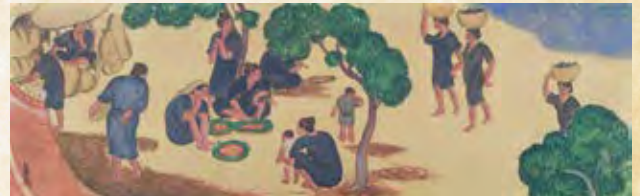
▲溝谷 国四郎《漁村の人々》、1925年、総社市蔵、前篇で展示