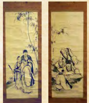
▲福原 五岳《竹林七賢人図》、制作年不詳、総社市蔵、後篇で展示