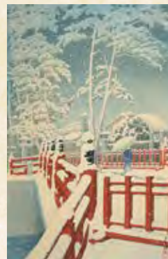
▲川瀬 巴水《神戸長田神社八雲橋》1930年、総社市蔵、後篇で展示