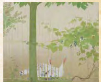
▲稲葉 春生《葡萄に七面鳥》、制作年不詳、総社市蔵、前篇で展示